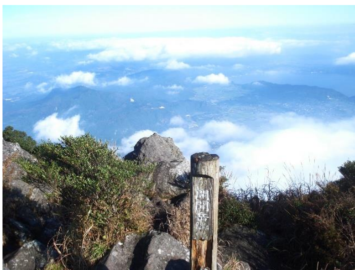
(↑山頂から薩摩半島方面)