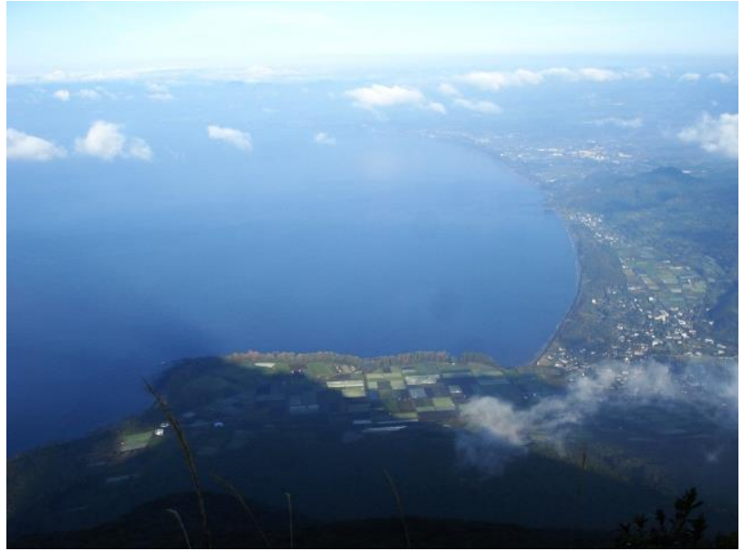
(9 合目途中からの景色、影は開聞岳)