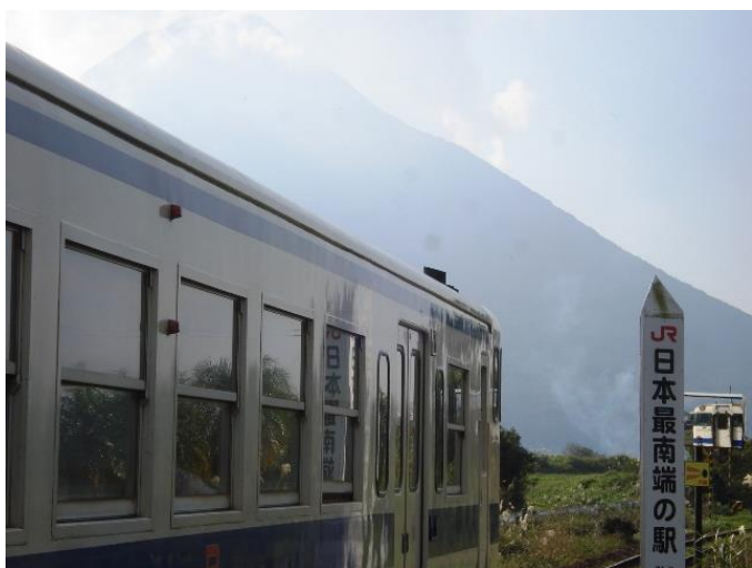
(日本最南端の JR 駅 西大山駅と開聞岳)