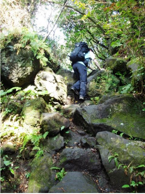
(7 合目から 8 合目までの途中)

8 合目に向け、大きな岩場をよじ登る、ちょっとしたロープ場が出て来る。軍手があるといいかもしれない。