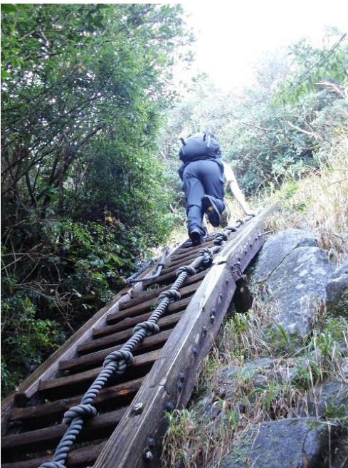
(9 合目標識過ぎた後の梯子)