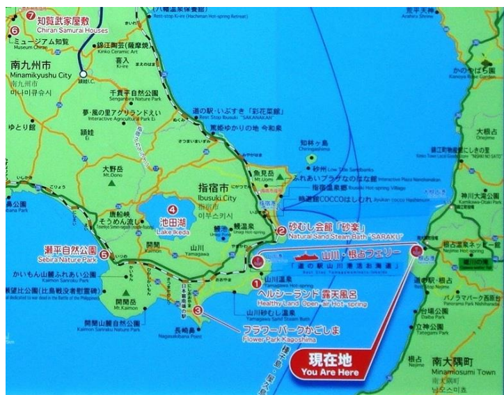
(根占港での掲示板)

祖母の家から開聞岳は車でないとかなりの距離なため、登山前日に開聞岳に近い指宿という町で一泊し翌日下山後そのまま鹿児島空港まで行き、飛行機で東京に戻るというハードスケジュールになる。